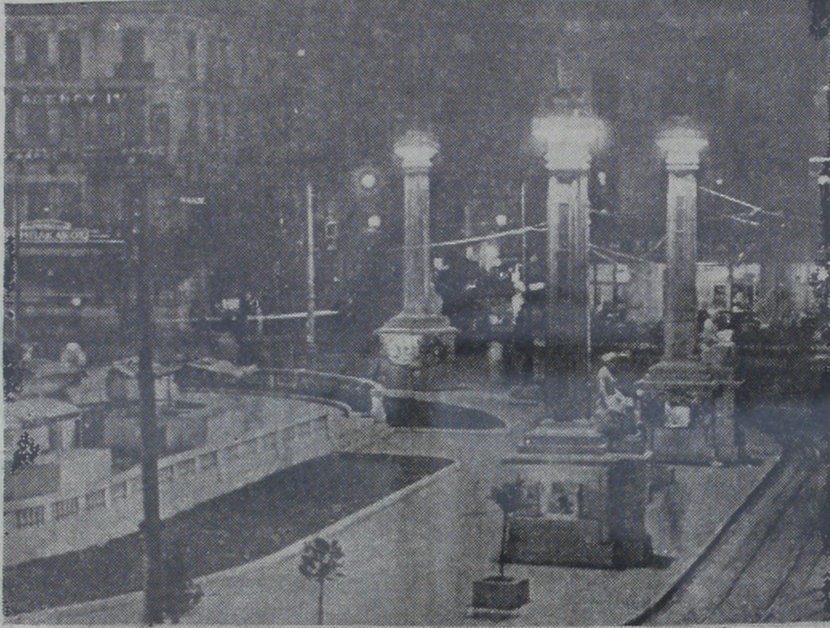
Atinada birlik meydanı

İyi haber alan siyasi mahfillerin tahminine göre, milli meclis yakında dağıtılacak ve son kanun (Sonu 6. ci sayıftada)