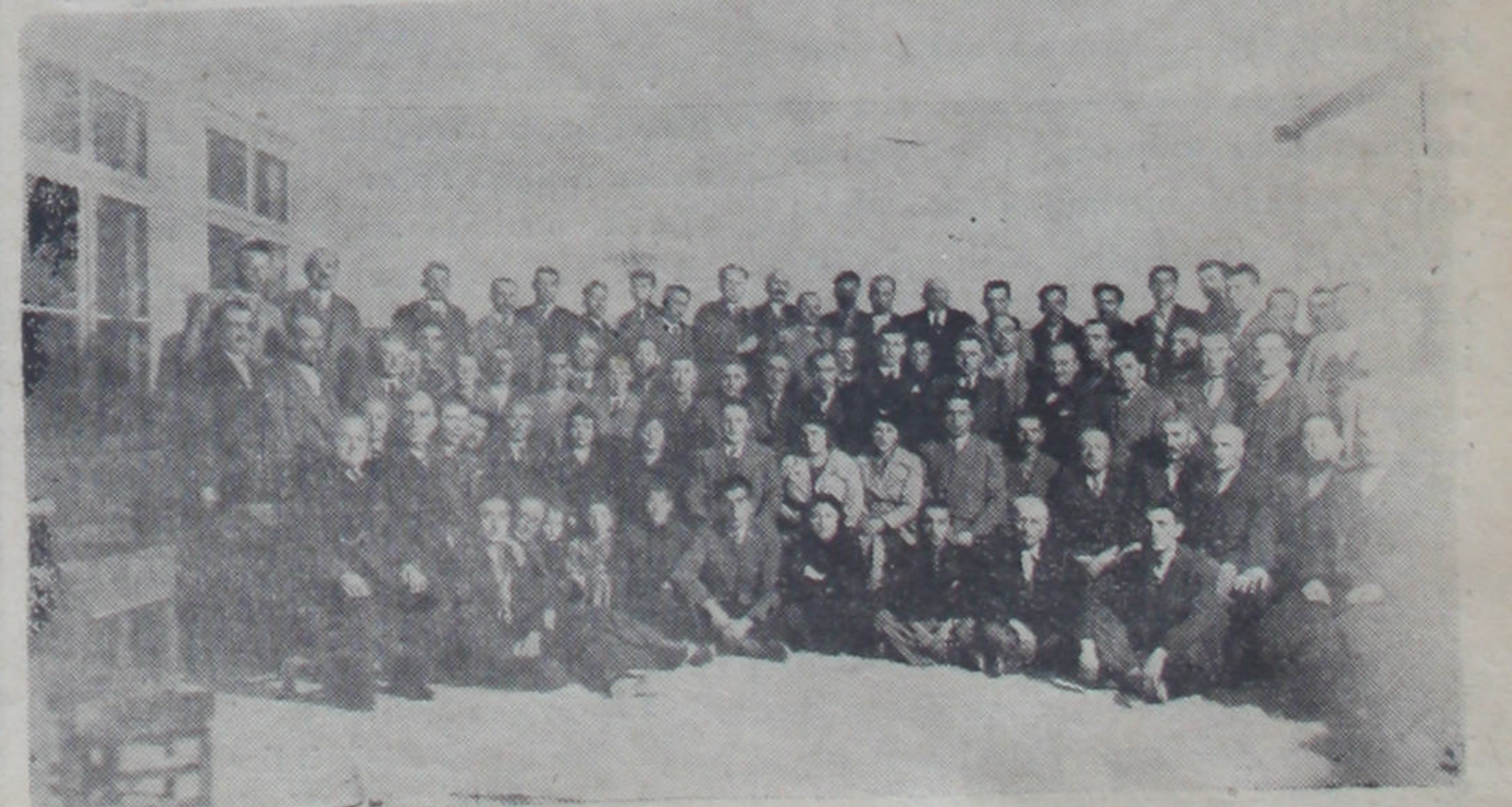
Hisar kamunu kongresi

(*) Köy öğretmenin anıları. Yazar: Ankara kültür yarıdirektörü M. Ferid Karşı. 254 sayfa. Tarık Edip Kitabevi. Tanesi 100 kuruş.