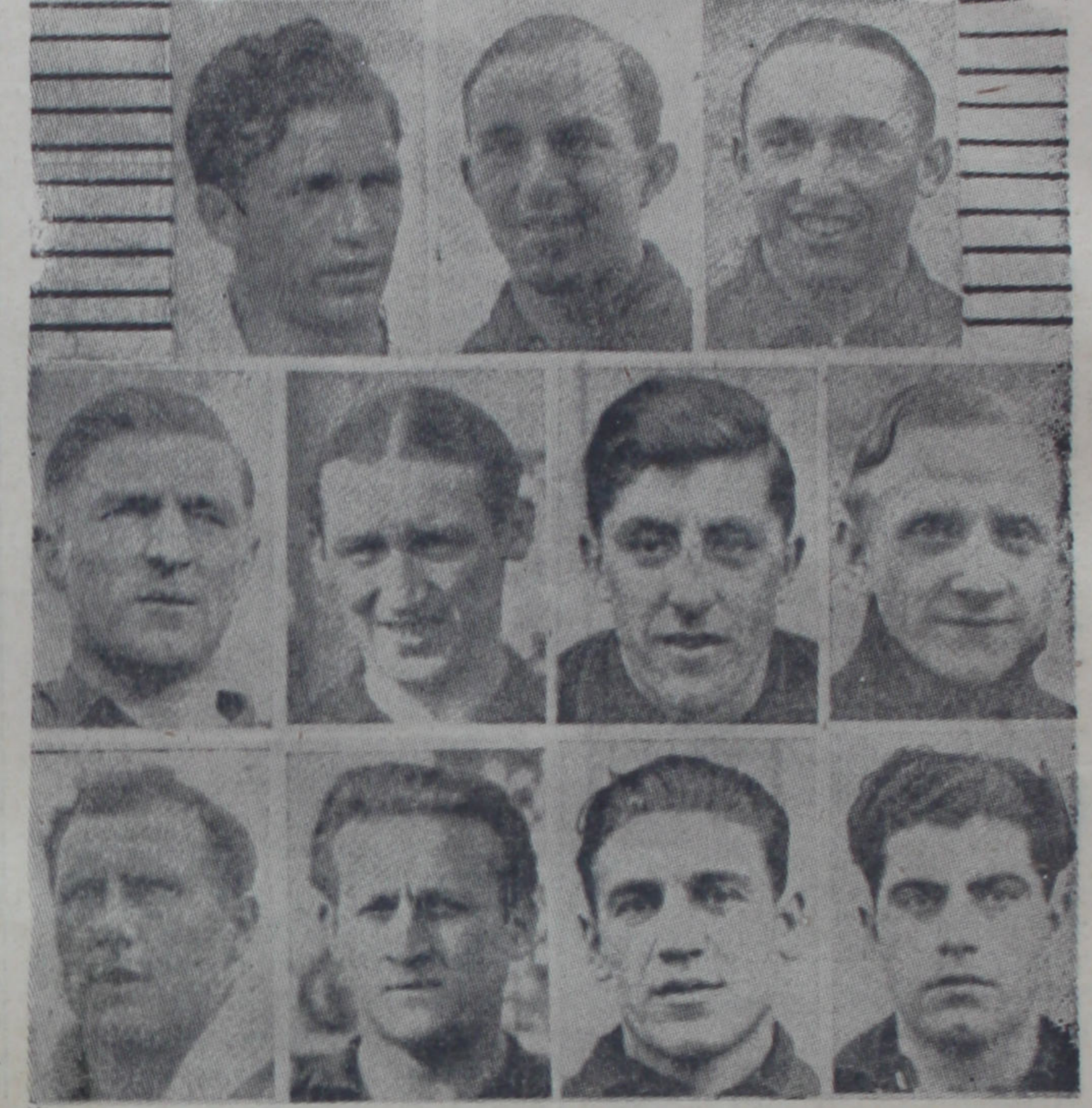
Londrada maç yapan Alman milli takımı