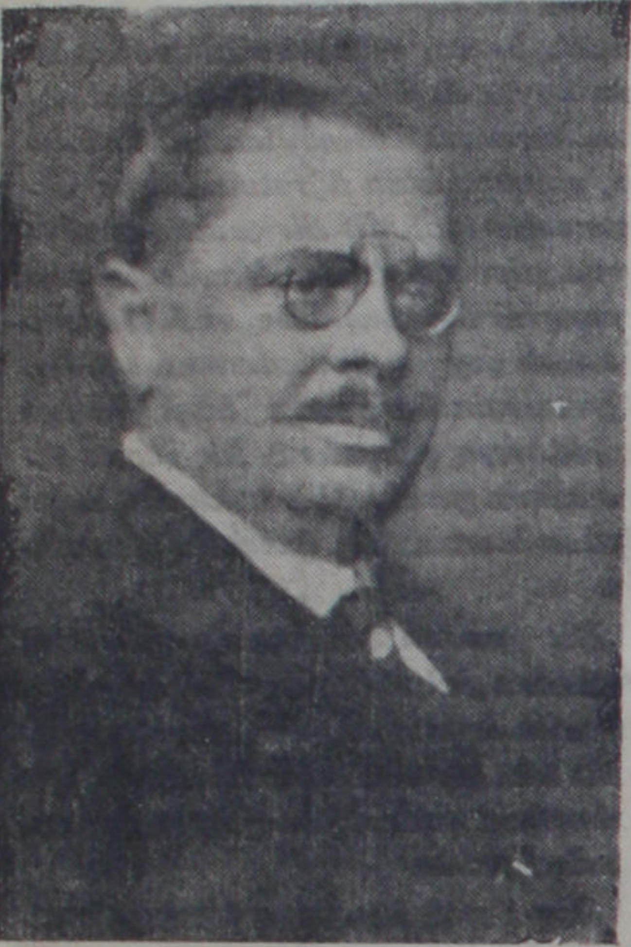
B. Jan Malipetr

Çekoslovakya Cumur Başkanı B. Mazarik'in bugünlerde sihi sebeblerden dolayı istifa edeceği söylenmektedir. Birkaç zamandanberi bu işten, kapalı bir tarzda arsulusal mahfilerde bahs olunmakta idi. Londra gazetelerinin verdikleri haberler ise, bu hadisenin nerede ise vukua geleceğini göstermektedir. Eğer B. Mazarik bugünkü şartlar içinde işinden çekilirse bu çekiliş Çekoslovakya tarihinde bir hâdise olmakla kalmıy-