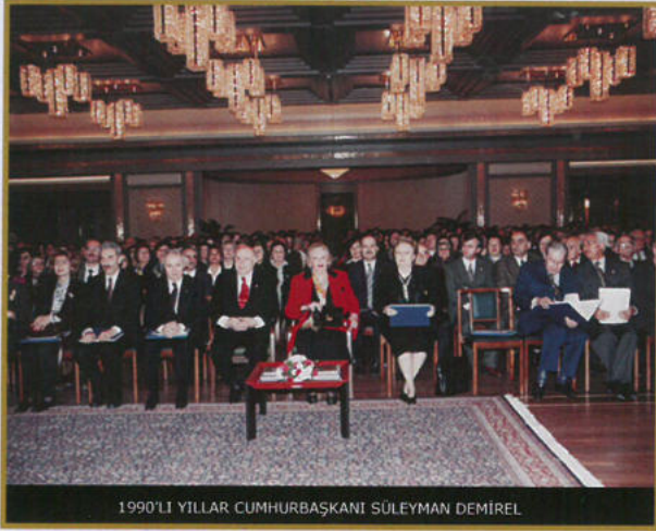
1990'LI YILLAR CUMHURBAŞKANI SÜLEYMAN DEMİREL

90'lı yılların sonunda yaşanan Dinar, Marmara ve Düzce depremlerinde dernek maddi ve manevi imkanları ile beraber tüm gücüyle halkımızın yanında hizmet vererek, Adapazarı Ferizli'de 5 katlı depreme dayanıklı Öğretmen Lojmanı yaptırmıştır.