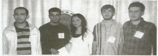
Türkiye Yardım Sevenler Derneği Üsküdar Şubesinde geçtiğimiz günlerde mutlu dakikalar yaşandı. Dernek yöneticileri ve üyeleri burs verdiği öğrencilerle buluştu, birlikte akşam yemeği yendi. Ardından 8 Mart Kadınlar günü için düzenlenen Kompozisyon yarışmasında dereceye giren öğrenciler...