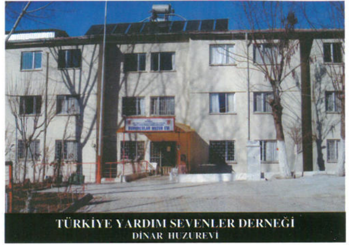
TÜRKİYE YARDIM SEVENLER DERNEĞİ DINAR - HUZUREVİ