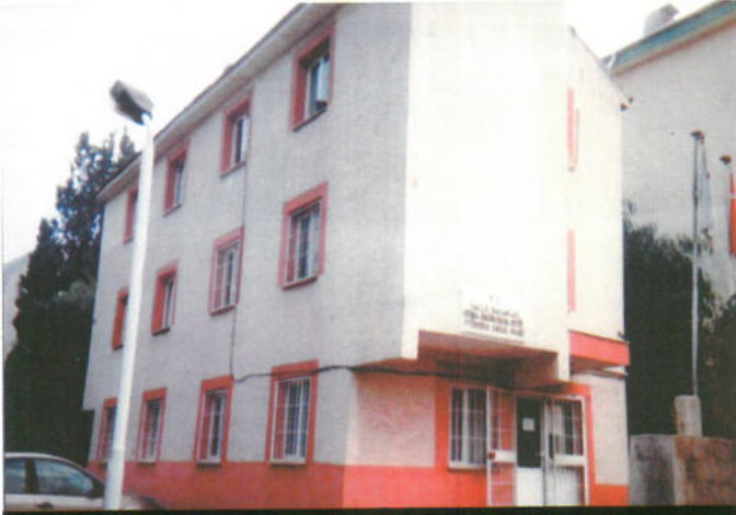
TÜRKİYE YARDIM SEVENLER DERNEĞİ İZMİR - SAĞLIK OCAĞI