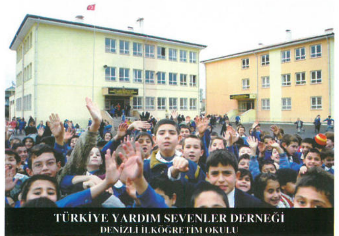
TÜRKİYE YARDIM SEVENLER DERNEĞİ DENİZLİ İLKÖĞRETİM OKULU