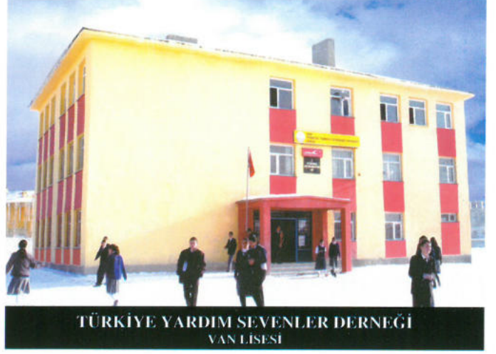
TÜRKİYE YARDIM SEVENLER DERNEĞİ VAN LİSESİ