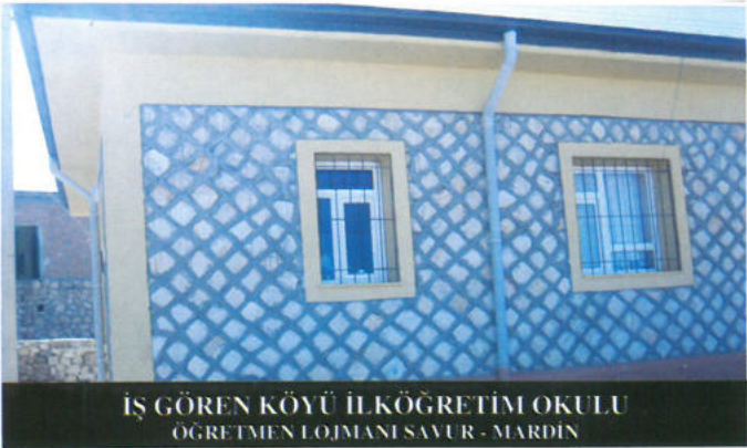
İŞ GÖREN KÖYÜ İLKÖĞRETİM OKULU ÖĞRETMEN LOJMANI SAVUR - MARDİN