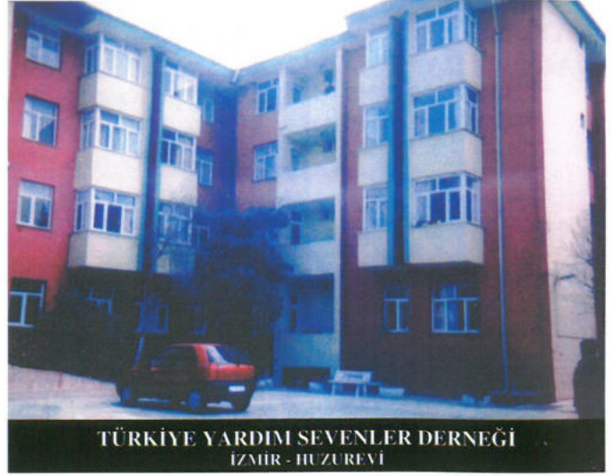
TÜRKİYE YARDIM SEVENLER DERNEĞİ IZMİR - HUZUREVİ