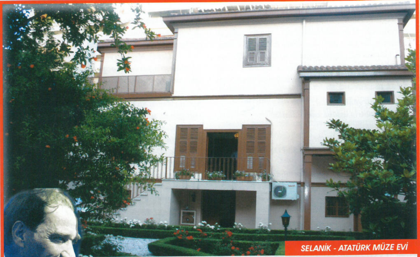
SELANİK - ATATÜRK MÜZE EVİ

KADININ YOKSULU OLMAZ KADIN BİZATİHİ BİR VARLIKTIR. M.K. ATATÜRK