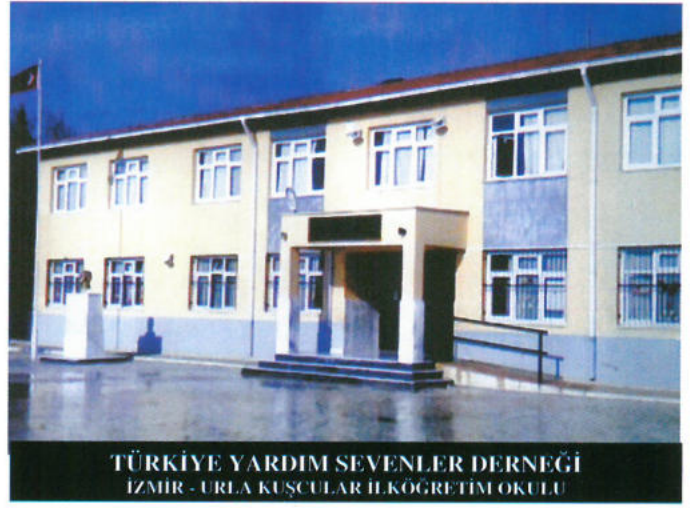
TÜRKİYE YARDIM SEVENLER DERNEĞİ İZMİR - URLA KUŞCULAR İLKÖĞRETİM OKULU