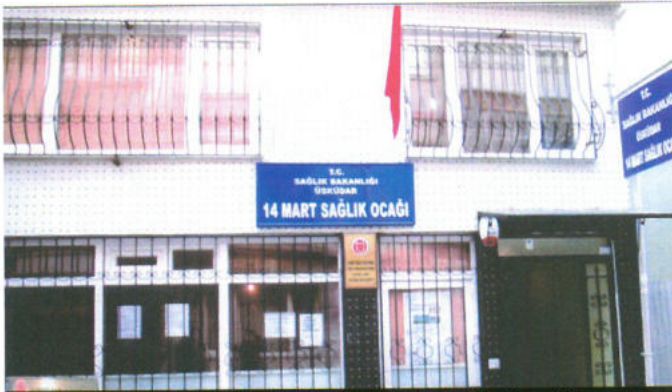
TÜRKİYE YARDIM SEVENLER DERNEĞİ ÜSKÜDAR ŞB. ÜSKÜDAR SAĞLIK OCAĞI - İSTANBUL