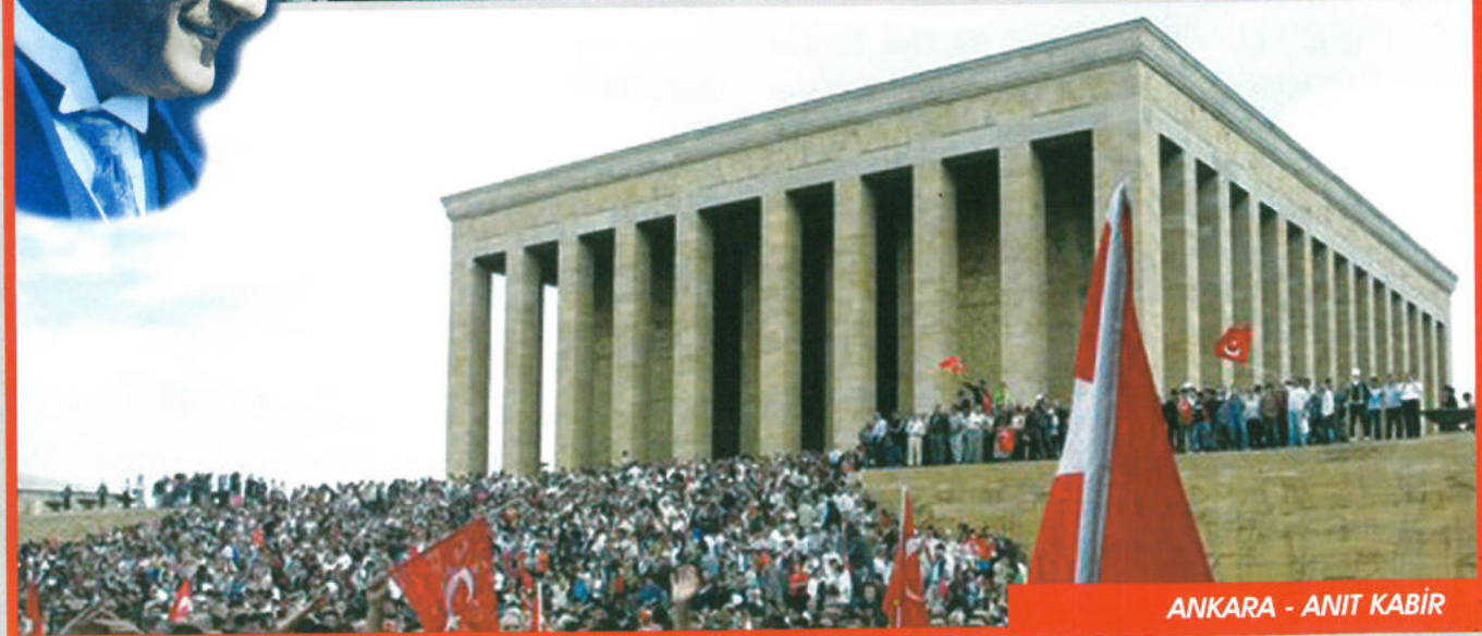
ANKARA - ANIT KABİR