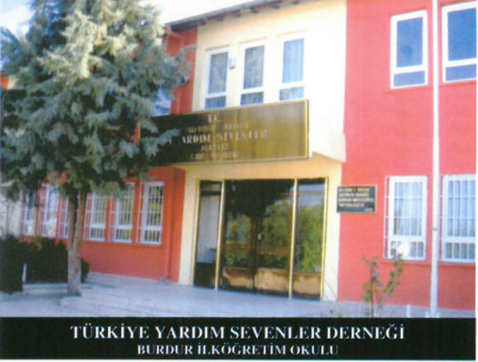
TÜRKİYE YARDIM SEVENLER DERNEĞİ BURDUR İLKÖĞRETİM OKULU