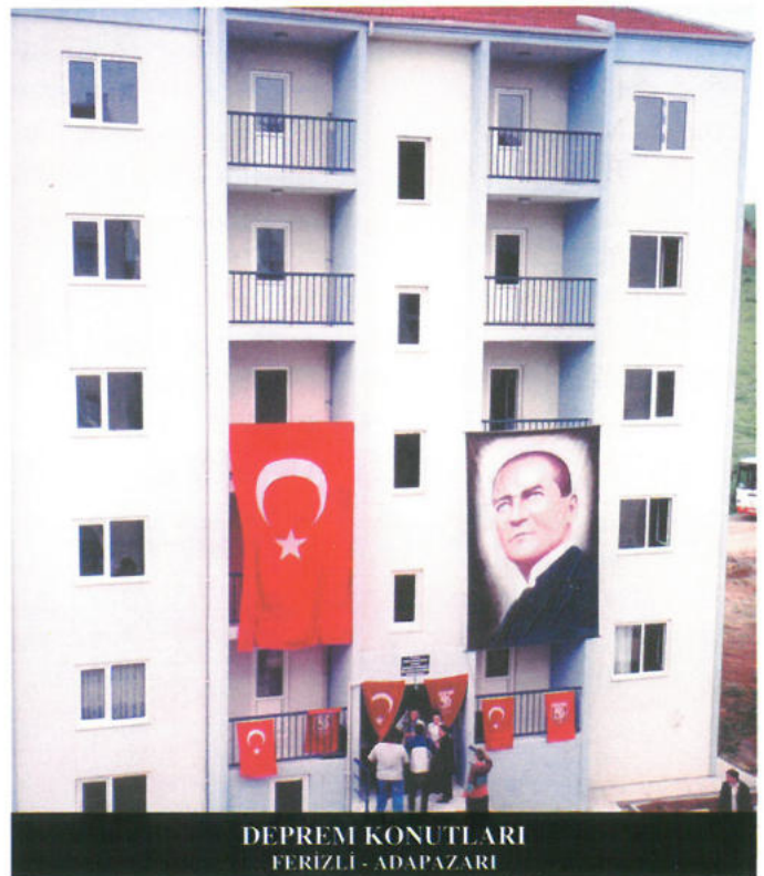
DEPREM KONUTLARI FERİZLİ - ADAPAZARI