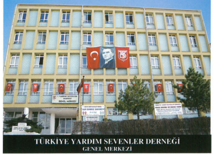
TÜRKİYE YARDIM SEVENLER DERNEĞİ GENEL MERKEZİ