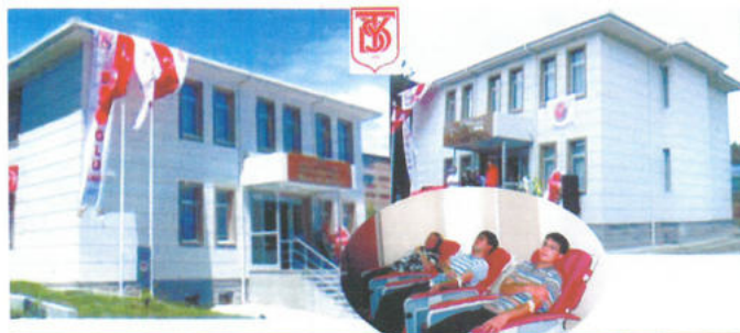
TÜRKİYE YARDIM SEVENLER DERNEĞİ BEYOĞLU ŞB. BAKIRKÖY İL ŞİNASİ URAL KAN MERKEZİ - İSTANBUL