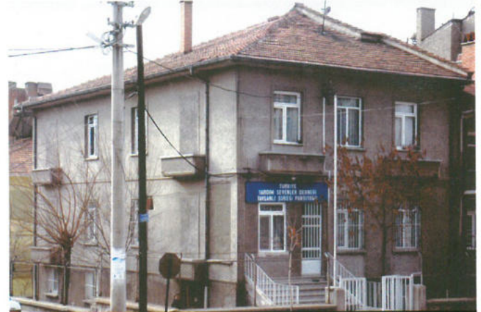
TÜRKİYE YARDIM SEVENLER DERNEĞİ TAVŞANLI ÖĞRENCİ YURDU