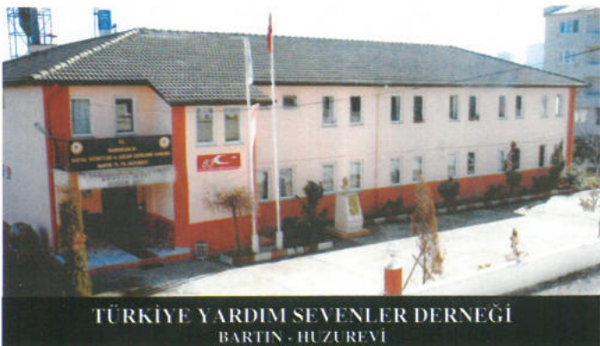
TÜRKİYE YARDIM SEVENLER DERNEĞİ BARTIN - HUZUREVİ