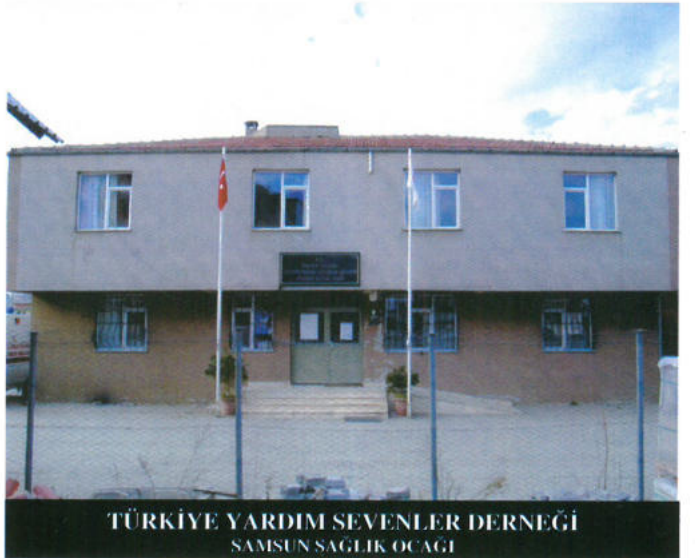
TÜRKİYE YARDIM SEVENLER DERNEĞİ SAMSUN SAĞLIK OCAĞI