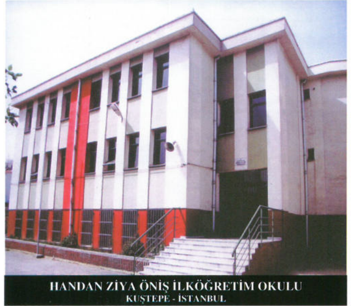
HANDAN ZİYA ÖNİŞ İLKÖĞRETİM OKULU KUŞTEPE - İSTANBUL