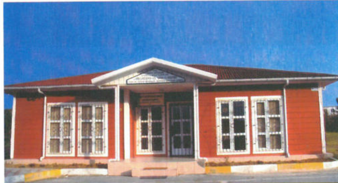
TÜRKİYE YARDIM SEVENLER DERNEĞİ ÜSKÜDAR ŞB. ÜSKÜDAR 112 ACİL SERVİS İSTASYONU - İSTANBUL