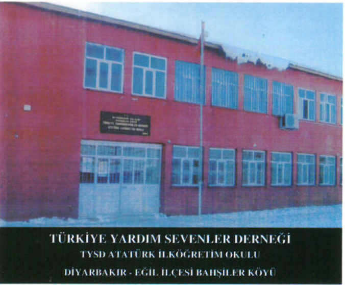
TÜRKİYE YARDIM SEVENLER DERNEĞİ TYS D ATATÜRK İLKÖĞRETİM OKULU DİYARBAKIR - EĞİL İLÇESİ BAHIŞILER KÖYÜ