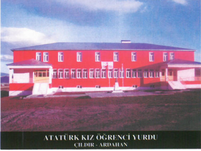
ATATÜRK KIZ ÖĞRENCİ YURDU CILDIR - ARDAHAN