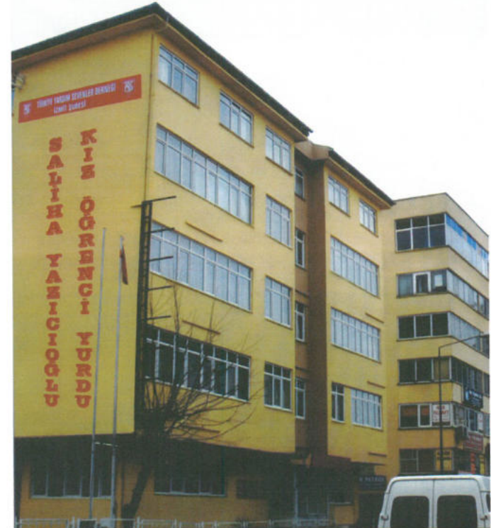
TÜRKİYE YARDIM SEVENLER DERNEĞİ İZMİR - KIZ ÖĞRENCİ YURDU