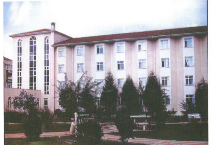
ATATÜRK KIZ ÖĞRENCİ YURDU AVCILAR - İSTANBUL