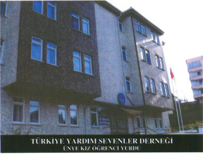
TÜRKİYE YARDIM SEVENLER DERNEĞİ ÜNYE KIZ ÖĞRENCİ YURDU