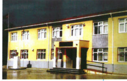
İzmir / Urla İlköğretim Okulu