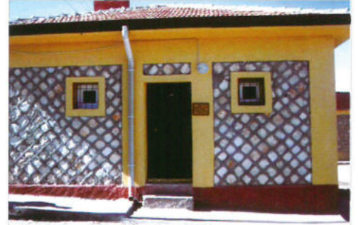
Mardin / Savur İşgören Köyü Öğretmen Lojmanı