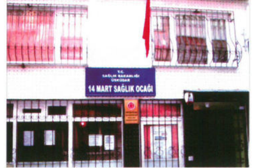
Üsküdar Sağlık Ocağı