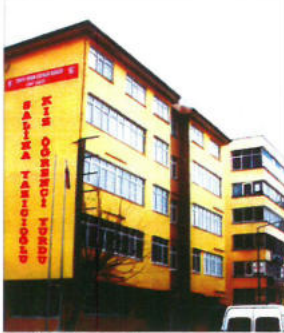
İzmit Kız Öğrenci Yurdu