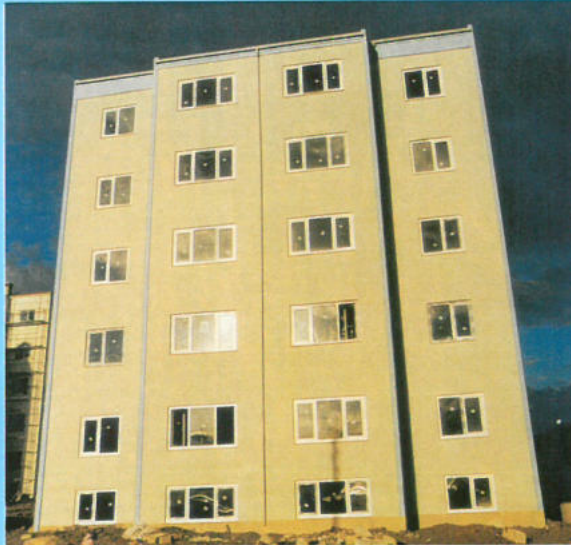
Deprem Bölgesi Adapazarı - Feyizli Çok amaçlı Eğitim Merkezi