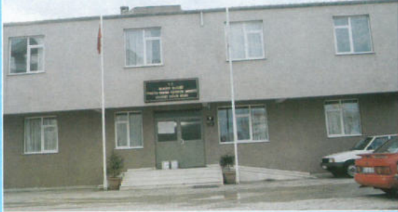
Samsun Ataşehir Sağlık Ocağı