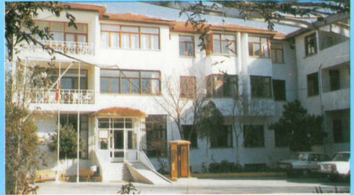
İzmir Karabağlar Huzurevi Dr. Kemal Tarım Dinlenme Evi