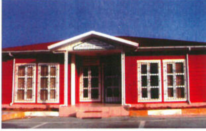
Üsküdar 112 Acil Servis İstasyonu