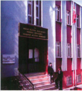
Muhsin Ertuğrul Çıraklık Okulu Zeytinburnu / İstanbul