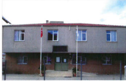
Samsun Sağlık Ocağı