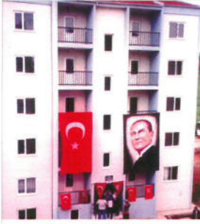
Deprem Konutu Ferizli / Adapazarı