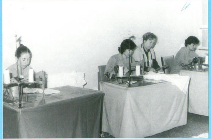
Genel Merkez Atölye