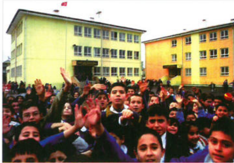
Denizli İlköğretim Okulu