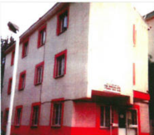
İzmir Sağlık Ocağı