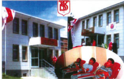
Bakırköy H. Şinasi Ural Kan Merkezi