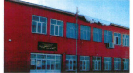
Diyarbakır Eğitim İlçesi Bahşiler Köyü T.Y.S.D. Atatürk İlköğretim Okulu