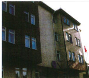
Ünye Kız Öğrenci Yurdu