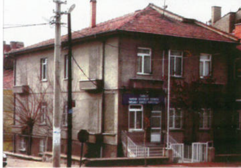
Tavşanlı Öğrenci Yurdu