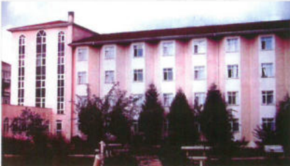
Atatürk Kız Öğrenci Yurdu Avcılar / İstanbul