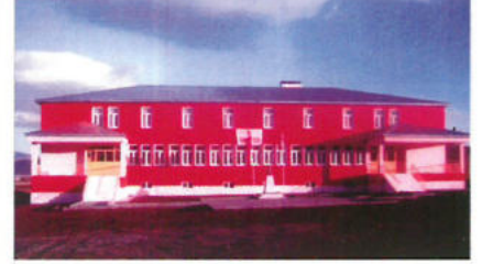
Atatürk Kız Öğrenci Yurdu Çıldır / Ardahan