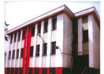
Handan Ziya Öniş İlköğretim Okulu Kuştepe / İstanbul