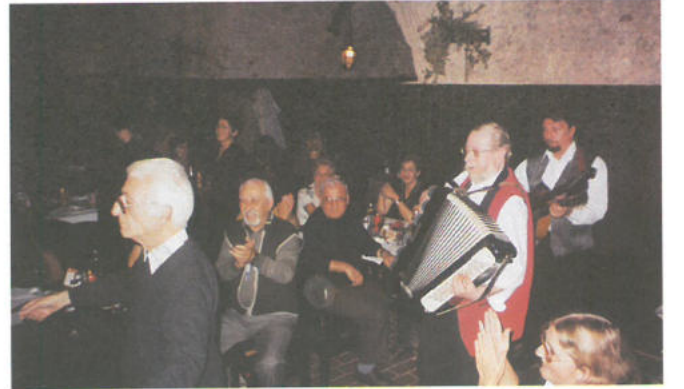
VİYANA PRAG GEZİSİNDEN GÖRÜNTÜLER