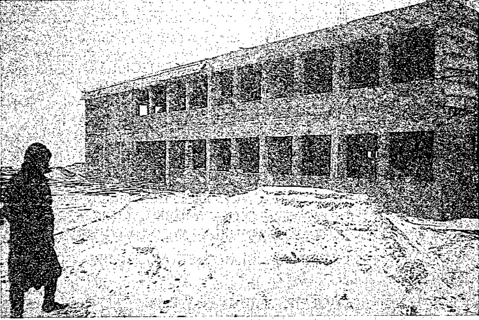
Okulumuzun inşaat durumundaki görüntüsü

Diyarbakır ili, Eğil ilçesi Bahşiler Köyü'nde yaptırdığımız okul.