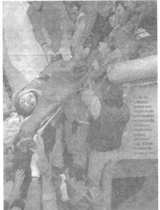
Türk ve yabancı yardım ekiplerinin çalışmalarında yüzlerce insanımız enkaz altından çıkılarak kurtarıldı.

Niğde Valiliği kanalıyla deprem bölgesine 200.000.000.-TL tutarında battaniye gönderilmiştir.