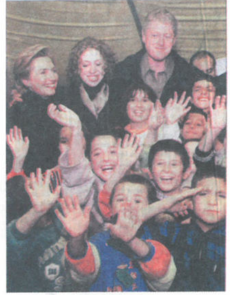
Yardımcı - Yardım