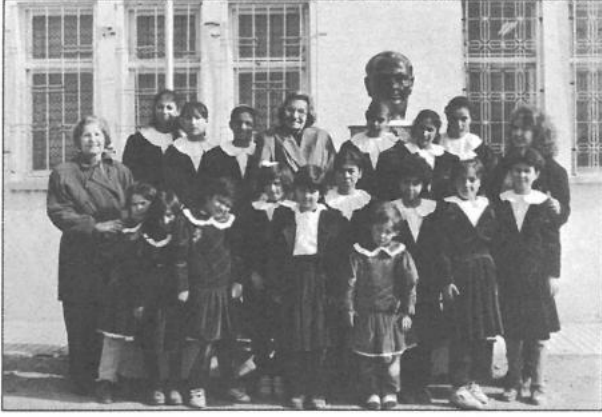
Manisa - Akhisar 16 kız öğrenciye bayramlık elbise dağıtımı