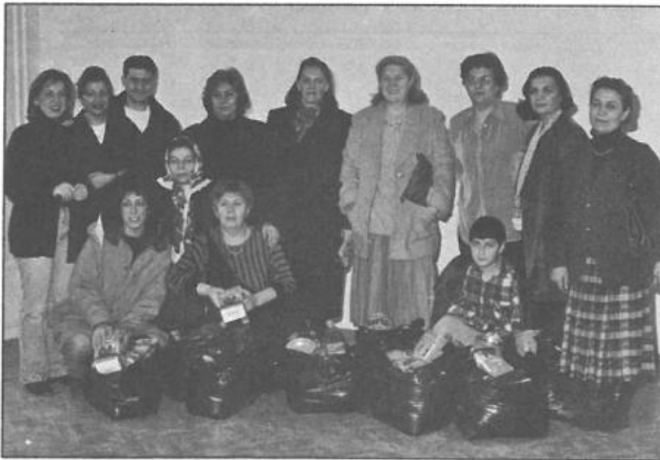
Malatya gıda yardımı