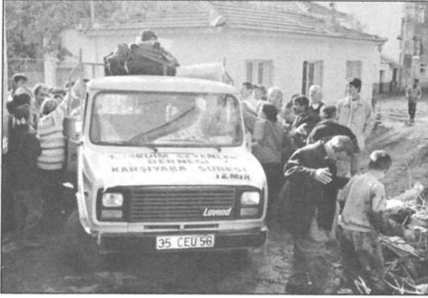
İzmir Karşıyaka sel felaketine yardım