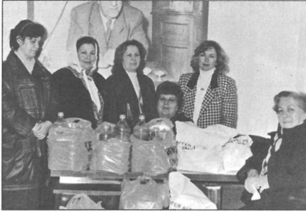
Edremit gıda dağıtımı