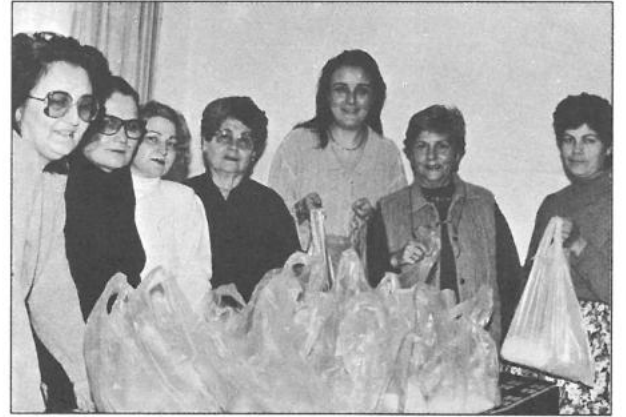
Aydın gıda yardımı