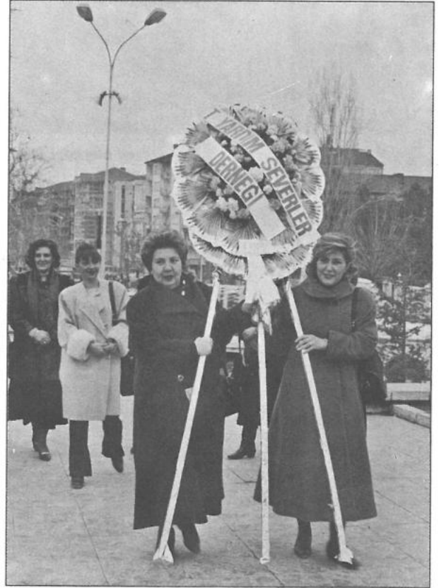
Malatya Dünya Kadınlar Gününde Atatürk'e çelenk sunarken