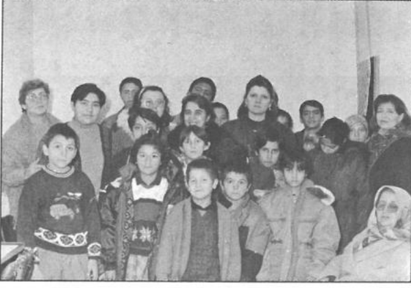
Nevşehir Yetiştirme Yurduna yardım