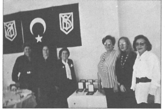
Manisa - Akhisar ödül töreni