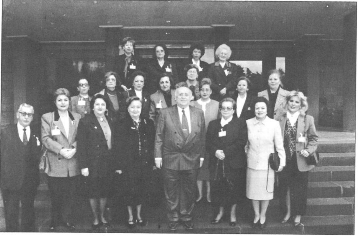
Genel Merkezi Sn. Cumhurbaşkanının Kabulü