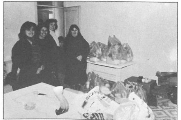
Yozgat - Berat (gümüş madalya)