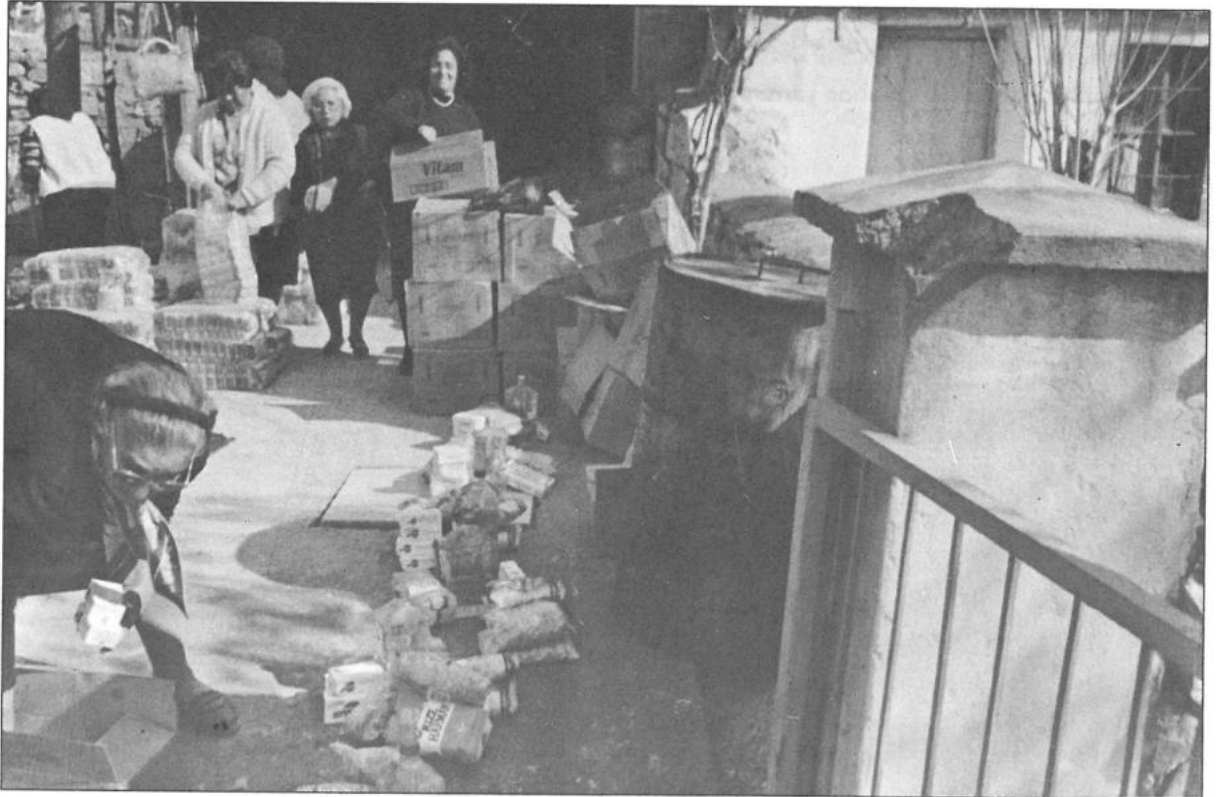
Kırşehir gıda dağıtımı