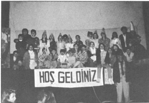
Bilecik Tiyatro çalışmaları